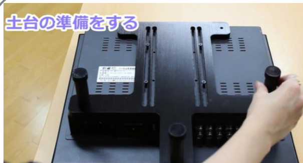
土台の準備をする