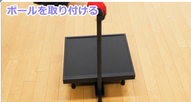
ポールを取り付ける

3. 液晶を保護する為に、付属のモニター隠しを写真のように載せて作業をしてください。