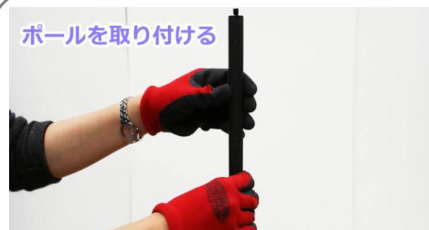
ポールを取り付ける