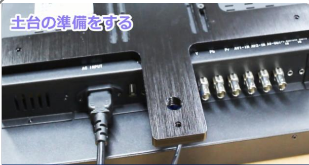
土台の準備をする