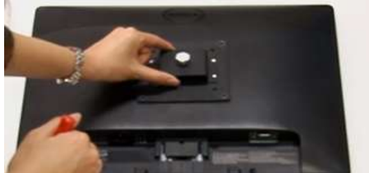
10 モニターの裏にアタッチメントを取り付けます。