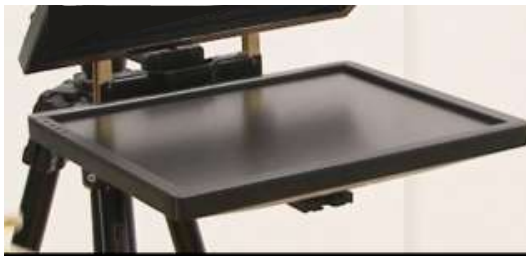
11. レールにモニターを通しねじで締めてください。